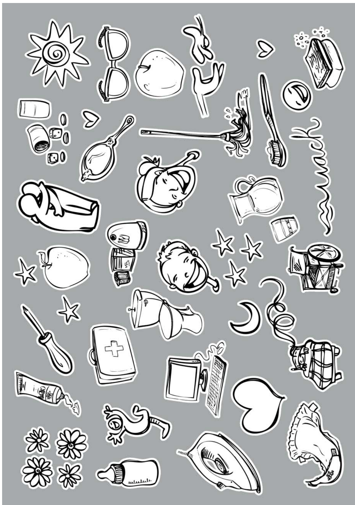
FICHA 2: LA MÁSCARA DEL CUIDADO