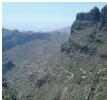
Bajada al caserío de Masca

cultivo en bancales favorecía un mayor aprovechamiento del espacio.