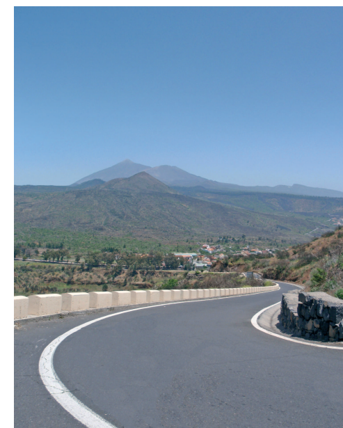
Vista del Teide y Pico Viejo

Abandonamos el caserío y continuamos por pronunciadas curvas hasta que ante nosotros aparece el valle de Santiago del Teide, con los volcanes del Teide y el Pico Viejo al fondo, donde termina nuestro trayecto.