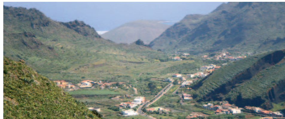
Panorámica del Palmar y Las Portelas

En este tramo se hace más patente la presencia de árboles frutales a ambos lados de la carretera, como higueras, almendros, naranjos y nispereros, además de tuneras. También cabe destacar