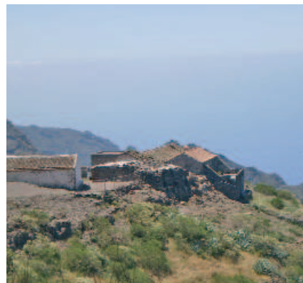
Conjunto de casas tradicionales

cultivo en bancales favorecía un mayor aprovechamiento del espacio.