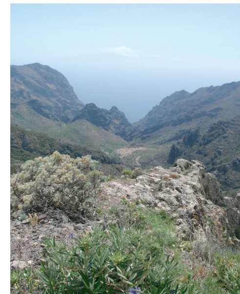
Vista del barranco del Carrizal

Así llegamos al mirador de la Cruz de Hilda desde donde se divisa el caserío de Masca, asentamiento caracterizado por su dispersión debido a la abrupta orografía del terreno. El aislamiento geográfico de esta zona propició una agricultura de autoconsumo, donde el