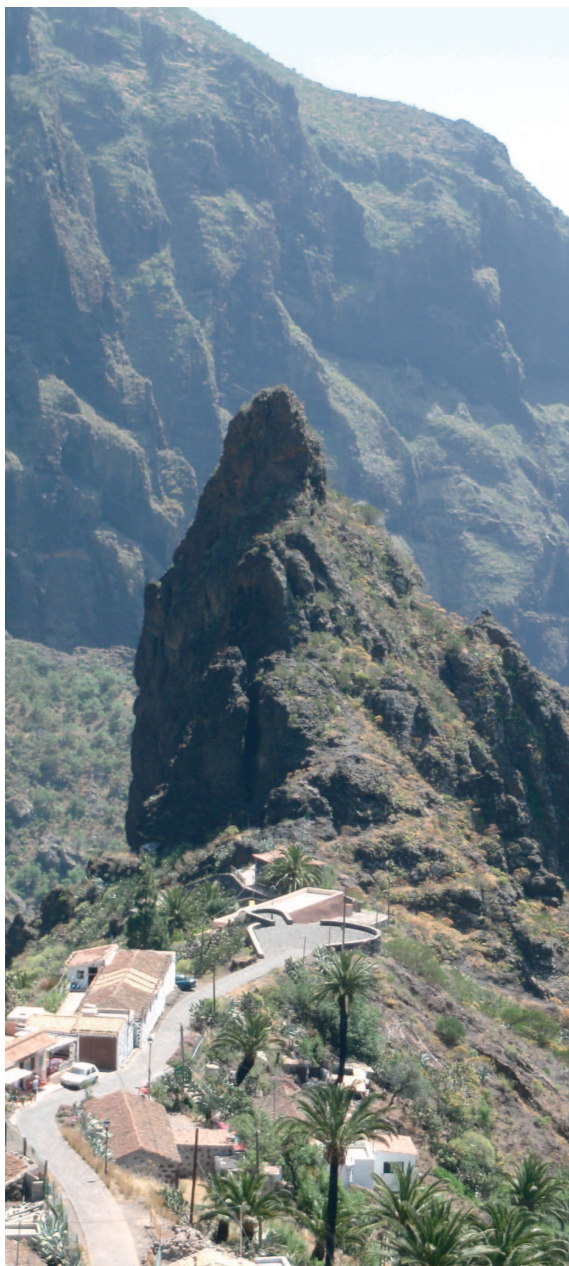
Caserío de Masca