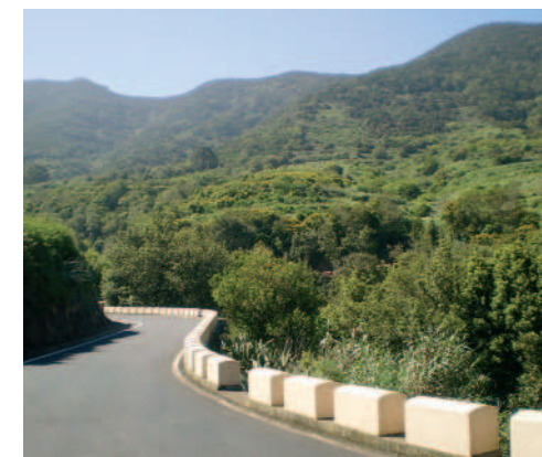
Formaciones de Monteverde en el ascenso a Teno