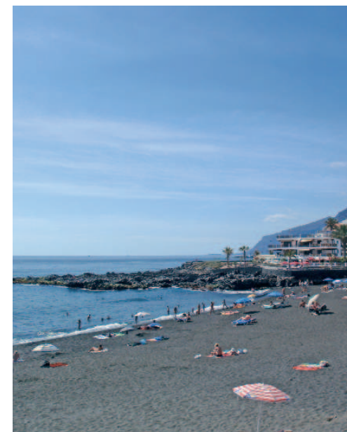
Playa La Arena

Al final de la carretera puede optar por desviarse a la izquierda hacia el núcleo turístico de los Acantilados de los Gigantes, con sus precipicios marinos de hasta 600 metros de altura, o bien dirigirse a la derecha, hacia el Parque Rural de Teno, macizo montañoso de gran valor paisajístico, ecológico y antropológico donde se pueden apreciar las particularidades agrícolas de la isla, su arquitectura tradicional, así como su riqueza florística y faunística.