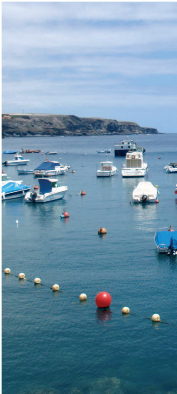
Playa de San Juan