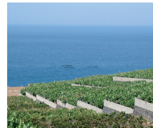
Monocultivo de plátano