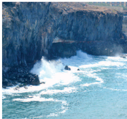
Acantilado de Isorana

acogen también 12 endemismos de la flora canaria.