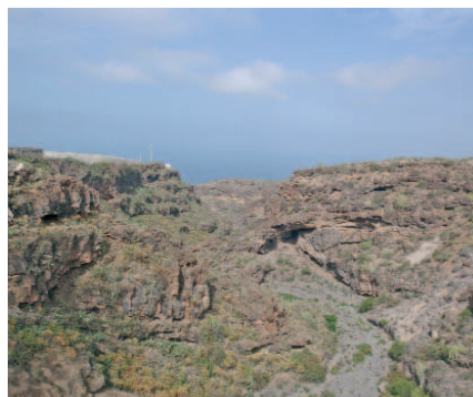
Barranco de Erques

A través del recorrido por esta carretera, también podemos ser testigo de otro de los potenciales económicos de