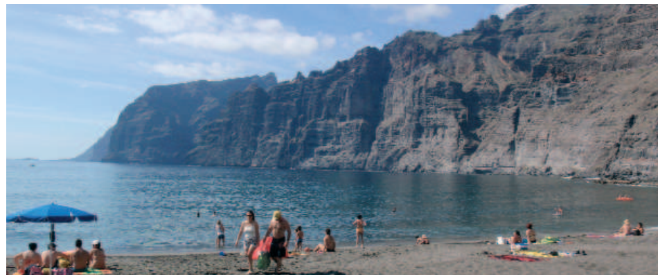
Playa de Los Gigantes

la isla: la acuicultura marina. La presencia de jaulas flotantes dedicadas al cultivo de dorada y lubina, nos hablan de